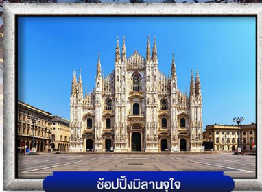
ซ้อปั้งมีลานจุใจ