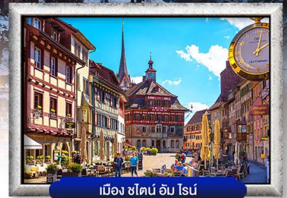
เมือง ซไตน์ อัม ไรน์